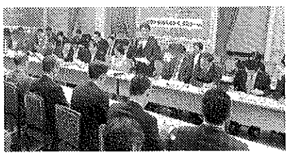
「桜を見る会」野党合同ヒアリング

者の取りまとめに関与していない」と答弁。しかし、怒りの世論の広がりの中、ついに20日、「推薦者について意見を言うこともあった」と答弁。当初の答弁の虚偽は明らかです。